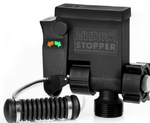
Føler til waterblock